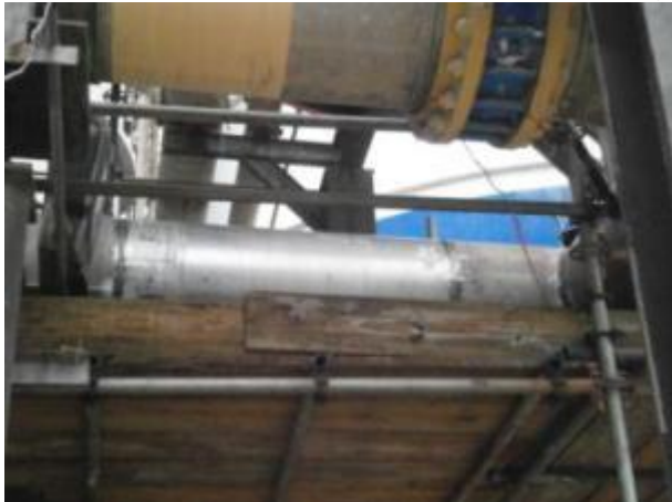
OM-22578558 SUBSTITUIR TRECHO TUBULAÇÃO 24" TAG 125BB204