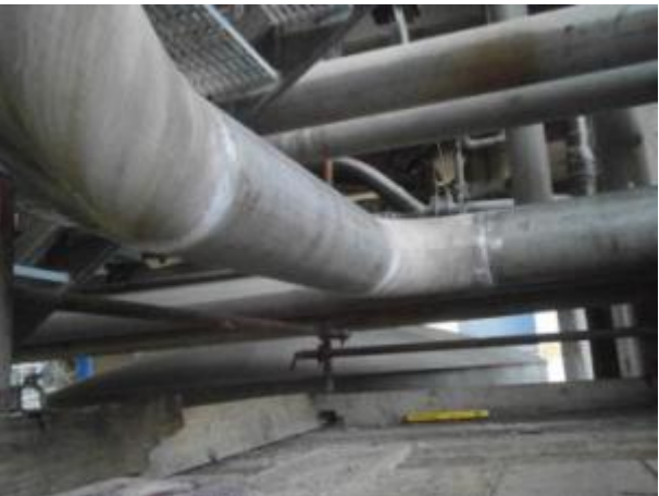
OM-22530699 SUBSTITUIR 6M TUBO DE 12" SCH10 A/I TAG 125BB304