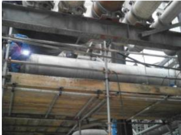
OM-22503257 SUBS TRECHO TUBO DE 12" TAG 125BB304