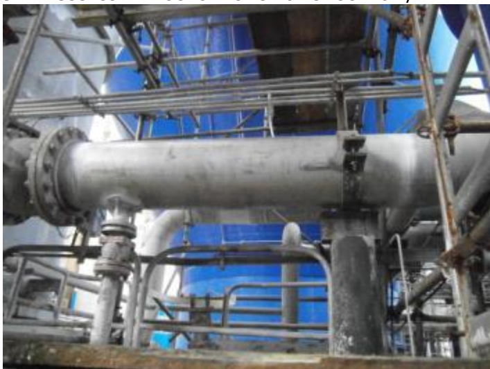
OM-22570964 SUBSTITUIR TRECHO TUBULAÇÃO 16POL TAG 125BB307